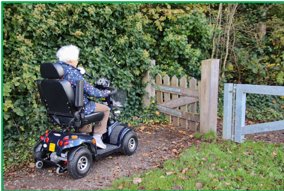
Foto: vrouw in scootmobiel bij klaphekje